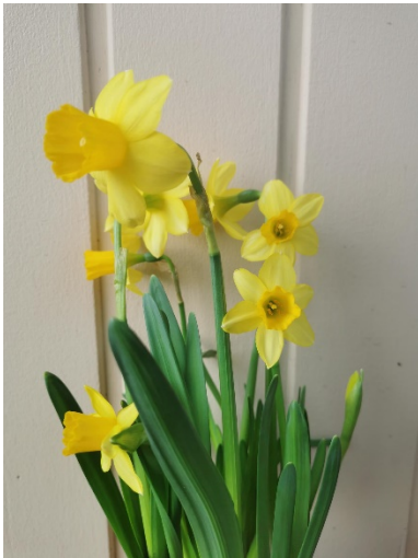
Abbildung: Osterglöckchen vom Vortrag

Am 26.04.2023 um 18.00 Uhr gibt es einen Vortrag zum Thema Klimapositivität/ Hofprojekt an der Universität Hildesheim hier angekündigt ist: https://www.uni-hildesheim.de/veranstaltungen/artikel/klimapositivitaet-konturen-eines-sich-entwickelnden-konzeptes-einblick-in-das-praxis-projekt-vortrag-im-rahmen-der-ringvorlesung-umwelt-nachhaltigkeit/